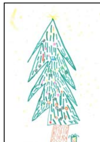
2. - 3 místo - Ruda Matoušek