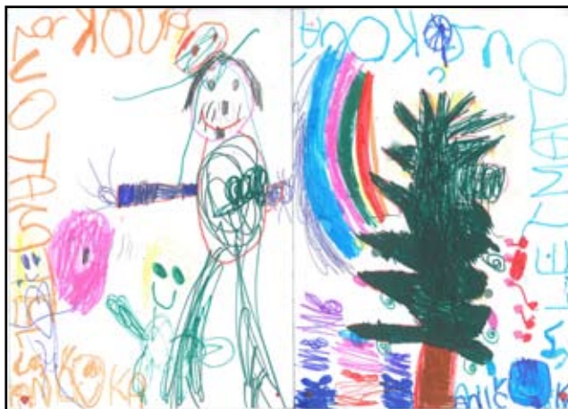
2. - 3 místo - Anička Matoušková